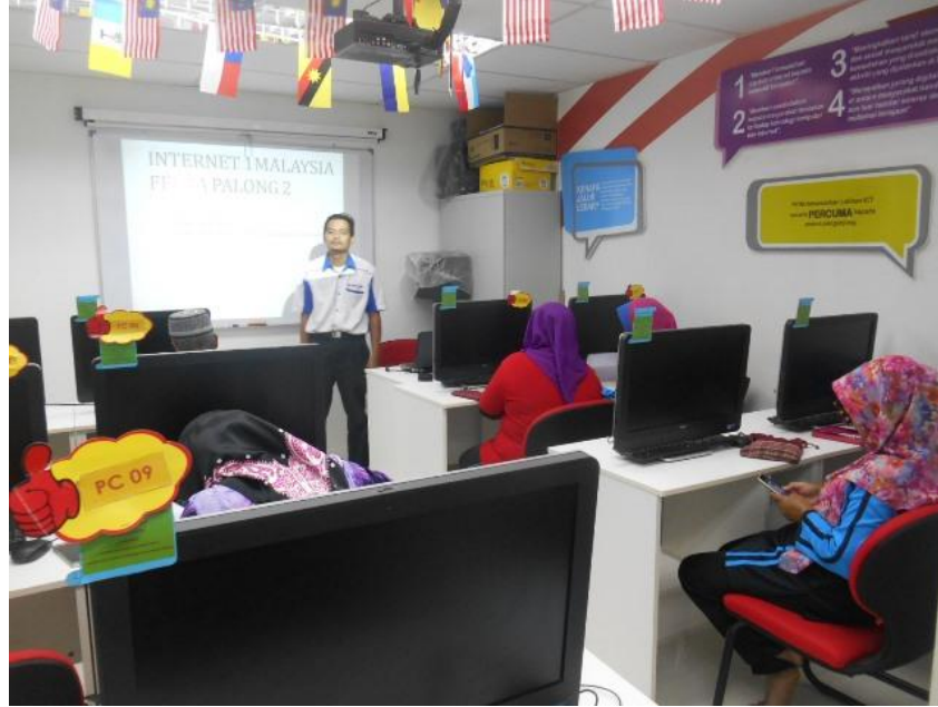
Taklimat daripada pengurus PI1M