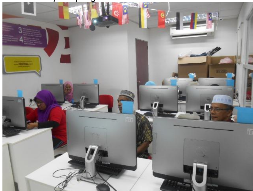
Ahli skuad sedang melaksanakan tugas daripada pengurus PI1M