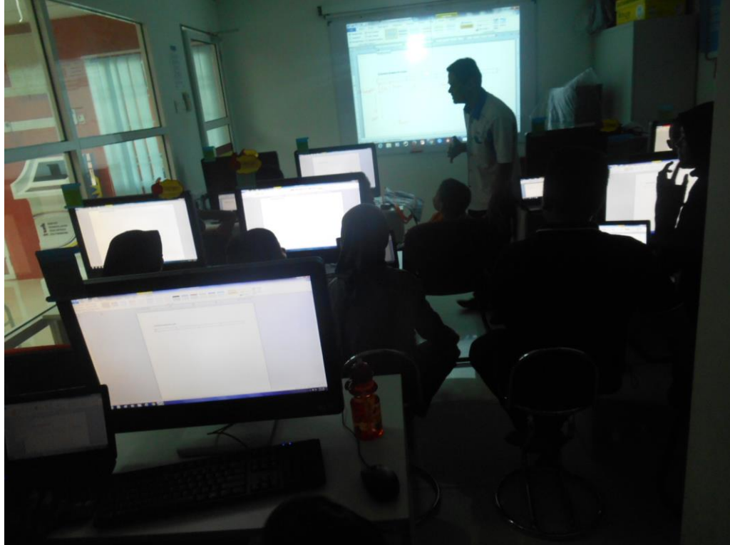
Para pelajar sedang melaksanakan tugas di Word