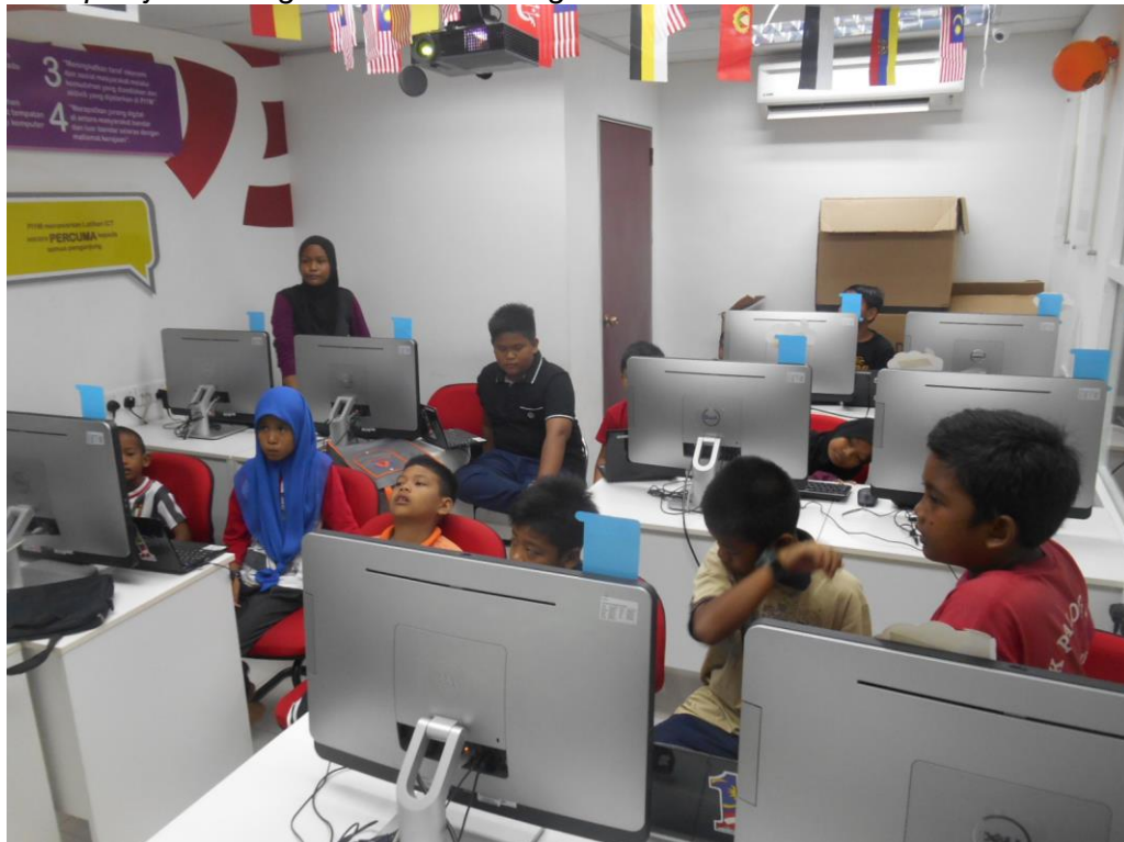
Antara pelajar yang hadir